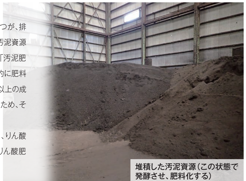
堆積した汚泥資源(この状態で発酵させ、肥料化する)

そこで、適切に品質管理して生産することにより、りん酸などの肥料成分の保証をできるようにした、「菌体りん酸肥料」が新たに誕生しました。