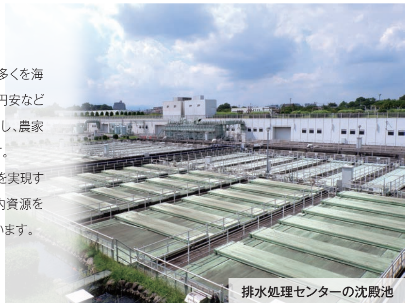
排水処理センターの沈殿池

国際情勢に左右されにくい安定的な肥料の供給を実現するため、海外の輸入原料を使用した肥料から、国内資源を活用した肥料への転換を進めることが求められています。