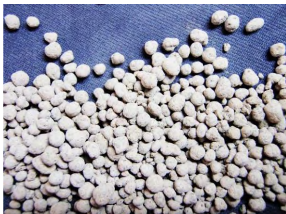
▲ 鉋さいマンガン肥料(1), 現物