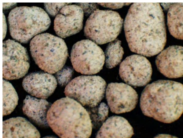
▲ 鉋さいマンガン肥料(1), 実体顕微鏡(10倍)