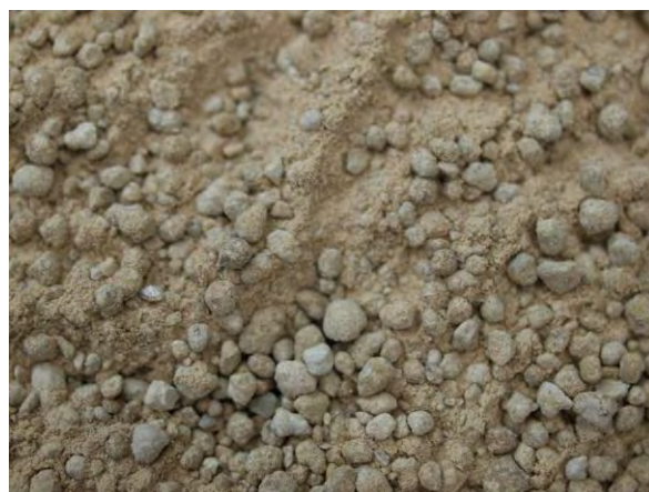
▲ 加工マンガン肥料(2), 実体顕微鏡(10倍)