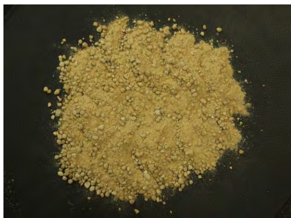
▲ 加工マンガン肥料(1), 現物