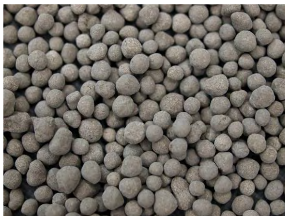
▲ 炭酸マンガン肥料(2), 実体顕微鏡(10倍) 写真のように粒状のものもある。