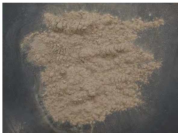
▲ 炭酸マンガン肥料(1), 現物 菱マンガン鉱を微粉碎したもの。