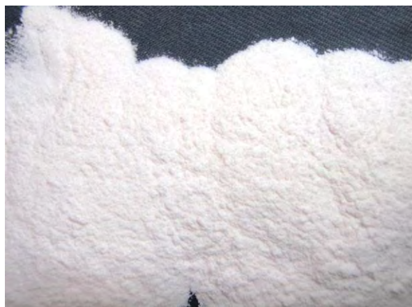
▲ 硫酸マンガン肥料(1), 現物