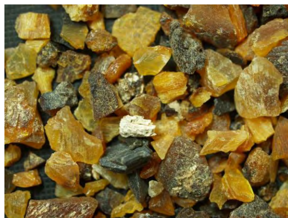
▲ 蒸製てい角骨粉(1), 実体顕微鏡(10倍)