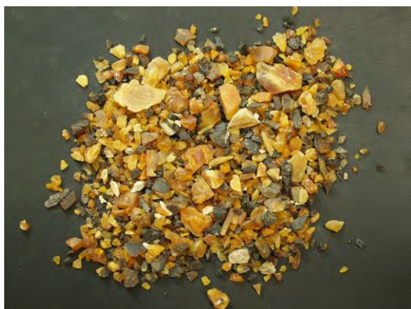
▲ 蒸製てい角骨粉(1), 現物