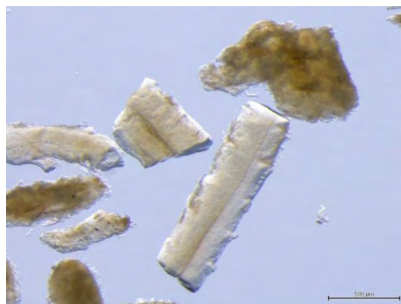
▲ 蒸製毛粉(1), 光学顕微鏡(酸処理, 100倍) 蒸製の程度にもよるが, 主に半透明の不定形を示す.