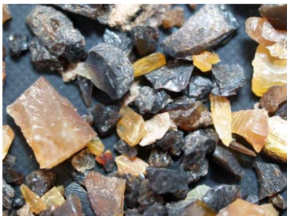
▲ 蒸製てい角粉(1), 実体顕微鏡(10倍)