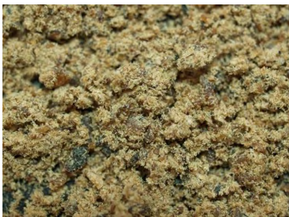
▲ 蒸製毛粉(1), 実体顕微鏡(10倍)