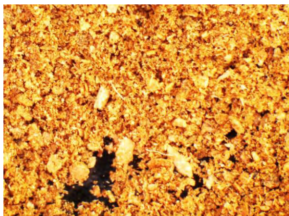
▲ たばこくず肥料粉末(1), 実体顕微鏡(10倍)