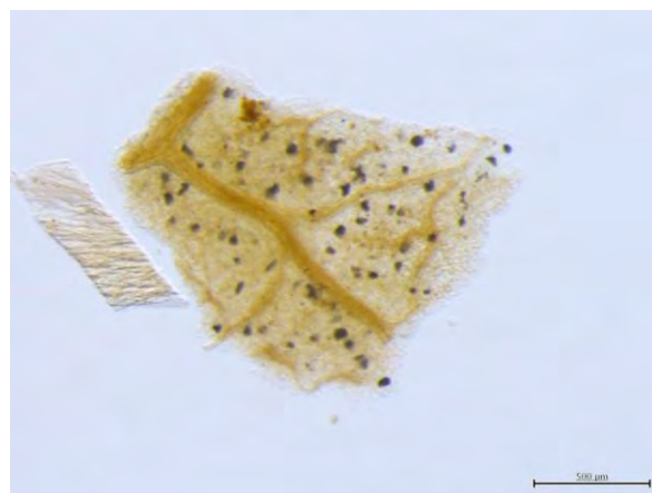
▲ たばこくず肥料粉末(1), 光学顕微鏡(アルカリ処理, 100倍)