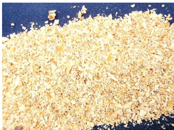
▲ とうもろこしはい芽油かす及びその粉末(1), 現物