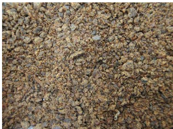
▲ カポック油かすおよびその粉末(1), 実体顕微鏡(10倍)