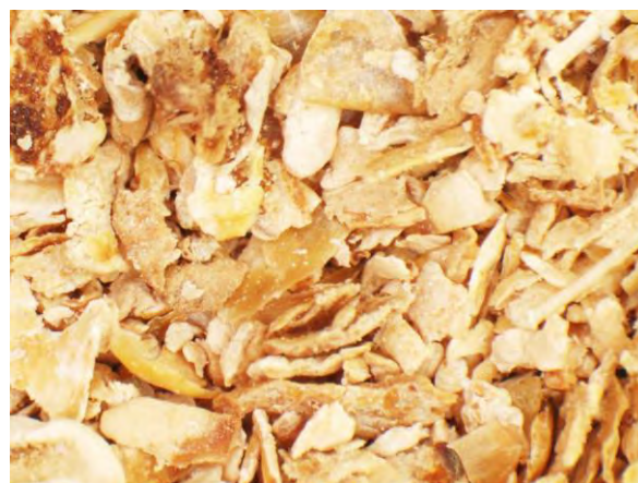
▲ とうもろこしはい芽油かす及びその粉末(1), 実体顕微鏡(10倍)