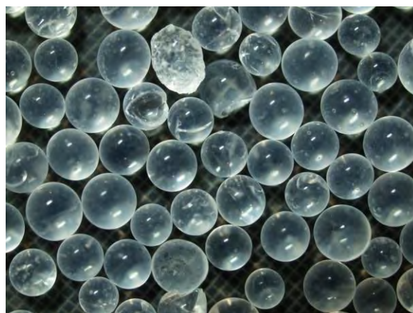
▲ シリカゲル肥料(1), 実体顕微鏡(10倍)