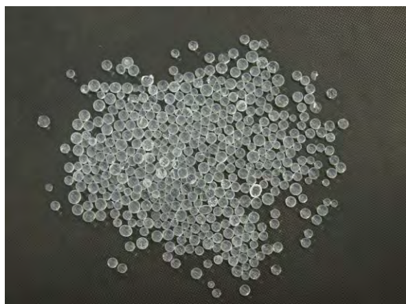
▲ シリカゲル肥料(1), 現物