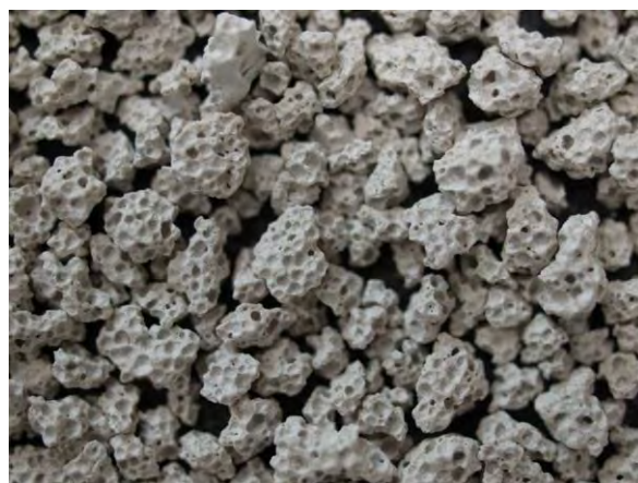
▲ 軽量気泡コンクリート粉末肥料(1), 実体顕微鏡(10倍) 写真のように、物理的には多孔質である。