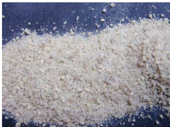
▲ 鉍さいけい酸質肥料(1), 現物