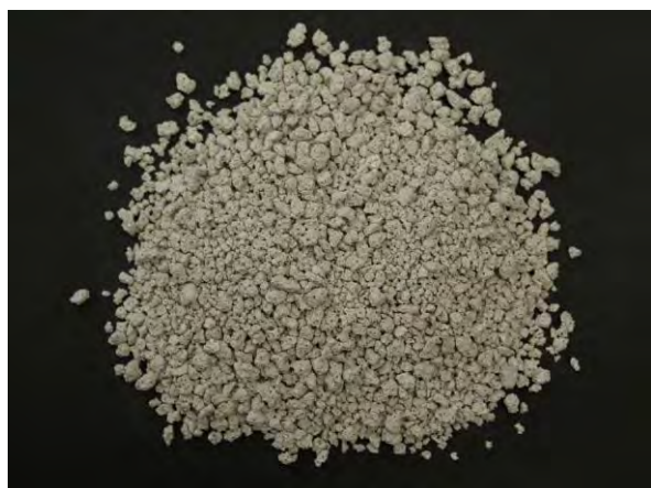
▲ 軽量気泡コンクリート粉末肥料(1), 現物