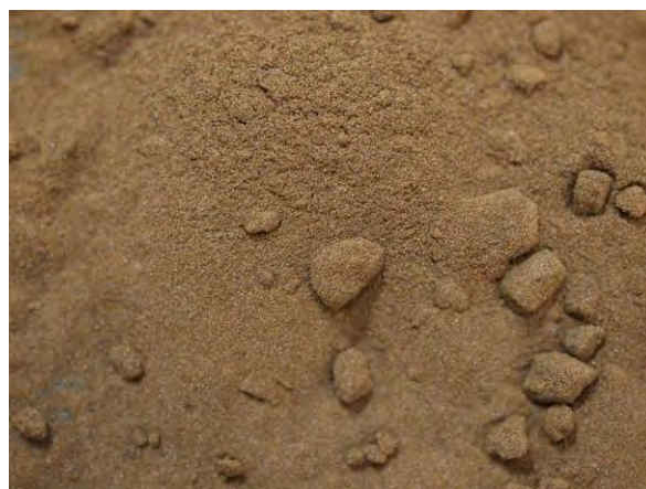
▲ リグニン苦土肥料(1), 実体顕微鏡(10倍)