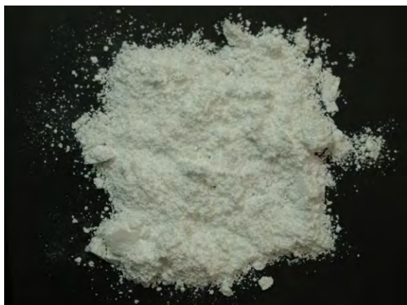
▲ 炭酸苦土肥料(1), 現物