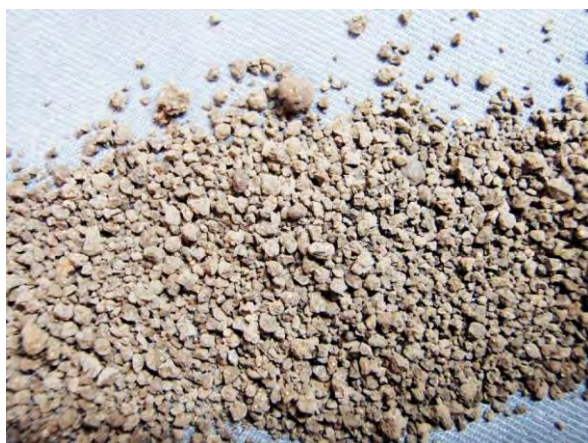
▲ 腐植酸苦土肥料(1), 現物