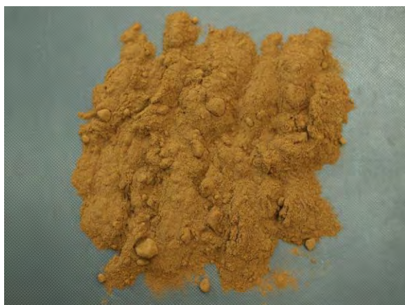
▲ リグニン苦土肥料(1), 現物